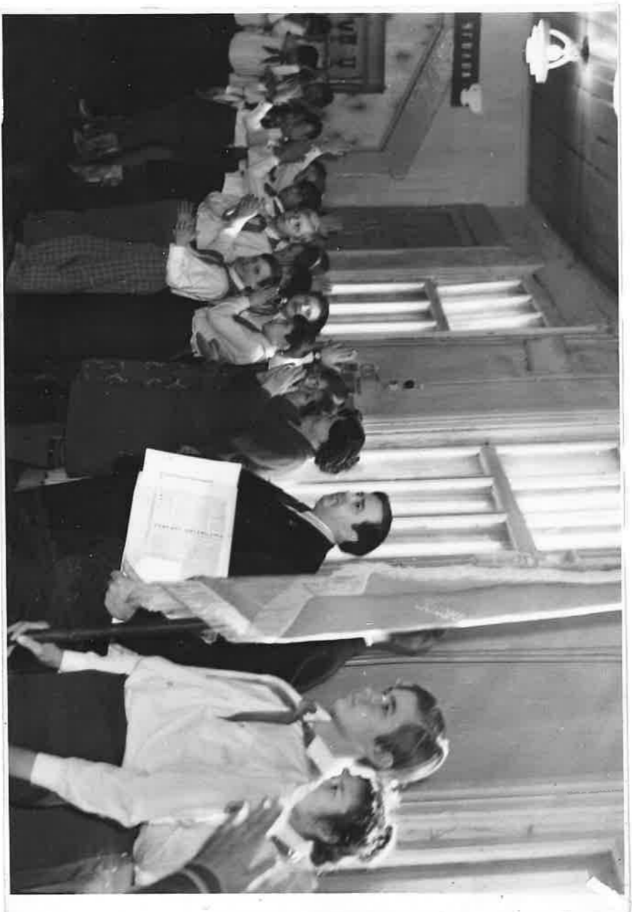
Первый секретарь Якутского ГК КПСС Суханов Н. В. приветствует пионеров школы № 5, получивших приветствие от делегата XXV съезда КПСС, летчика-космонавта, дважды Героя Советского Союза Андряна Николаева (начало марта 1976г.)