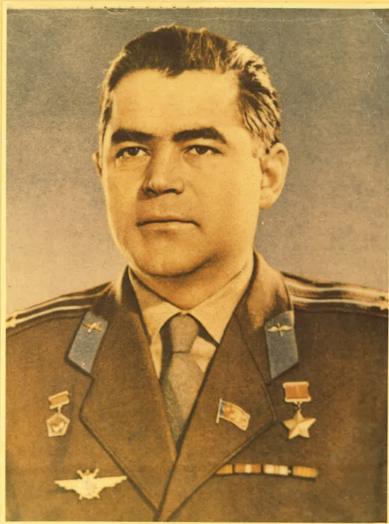
НИКОЛАЕВ АНДРИАН ГРИГОРЬЕВИЧ, летчик-космонавт СССР, дважды Герой Советского Союза